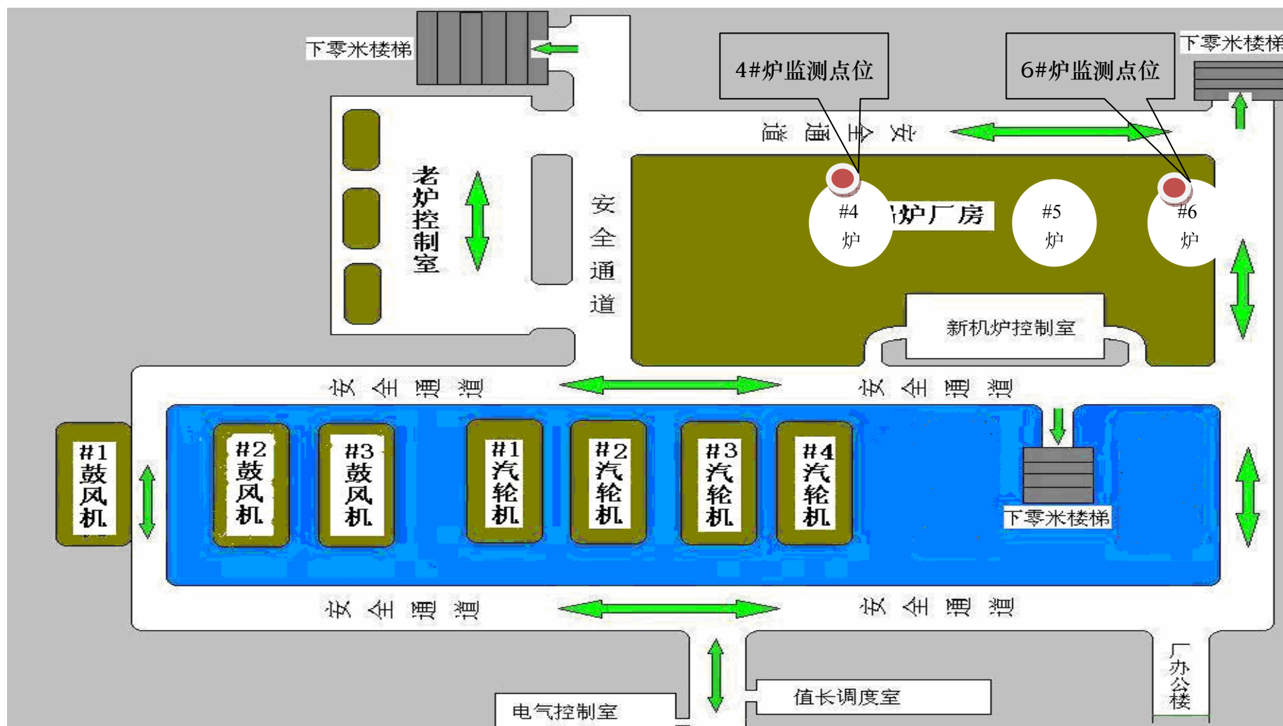
图 5-1 废气监测点位示意图