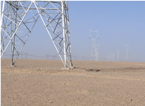
4月塔基区水土保持土地整治措施到位