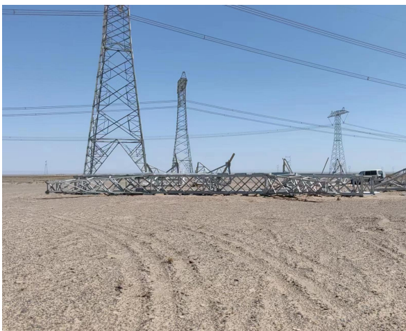
5月塔基区个别塔基停工