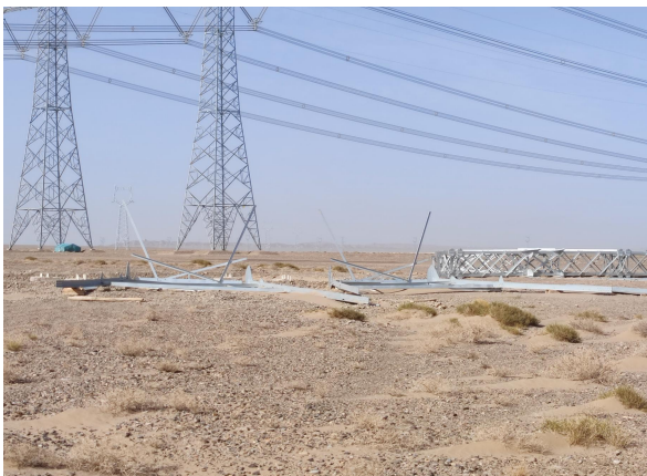
4月塔基区个别塔基停工