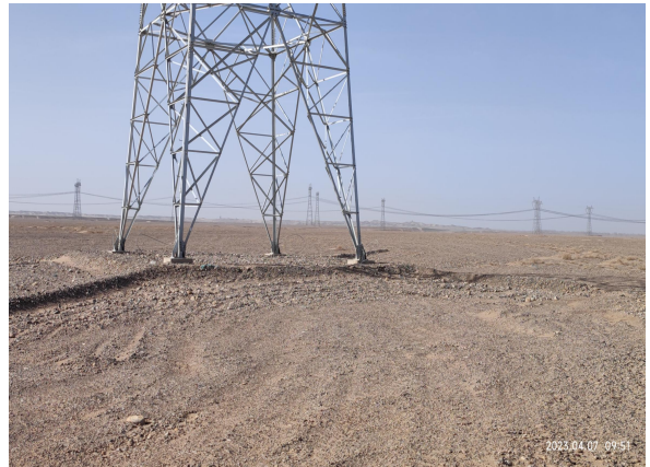
4月塔基区水土保持土地整治措施到位