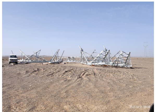
4月塔基区个别塔基停工